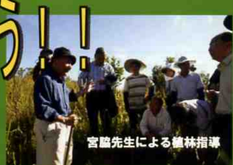
宮脇先生による植樹指導